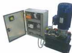
CENTRALINA CARGO 5-10-15-20